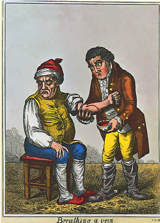
Aderlass (um 1805)

Die Medizin steckt noch in den Anfängen.