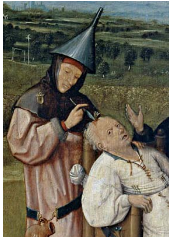
Hieronymus Bosch: Das Steinschneiden (um 1485)